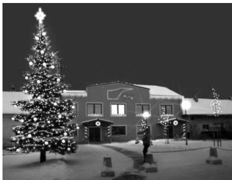
Návrh vánočního osvětlení