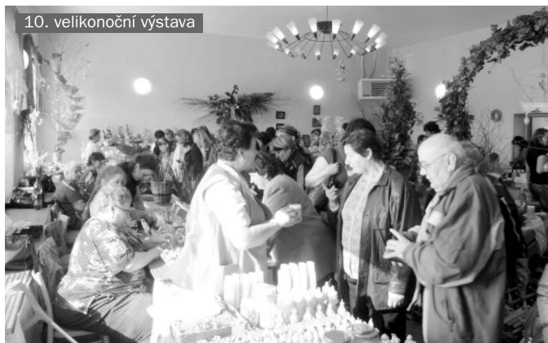
10. velikonoční výstava

Výrobky dětí z mateřské školy z Ústí potěšily každého svými vystřihovánkami, které zaplnily oponu. Netradičně zdobené kraslice, věnečky, motýlky jenom umocnilo jejich barev-