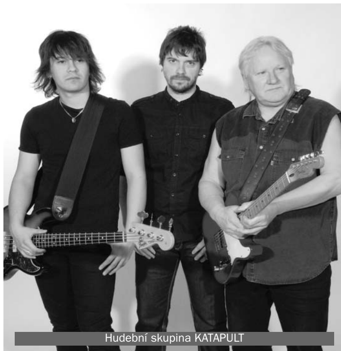
Hudební skupina KATAPULT